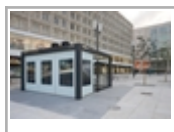
Toilettenanlage Alexanderplatz . JPG (293 kB)