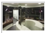
Alex_01. JPG (406 kB)